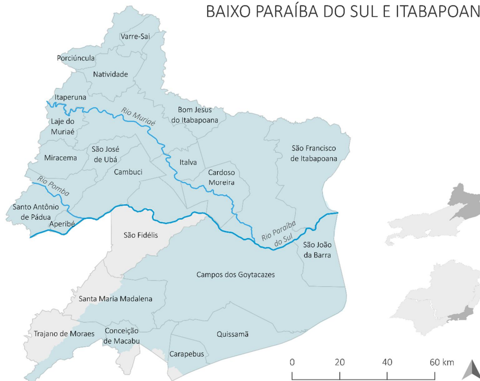
Figura 2. Mapa da Região Hidrográfica Baixo Paraíba do Sul e Itabapoana e área de atuação do CBH-BPSI.