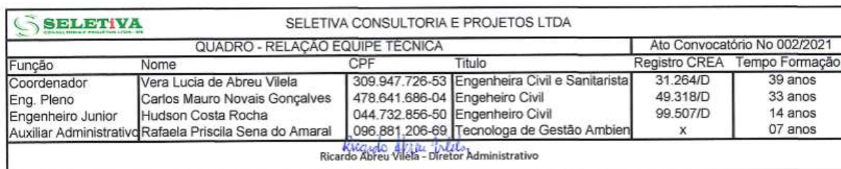
Figura 3: Quadro com profissionais da equipe permanente - Seletiva Consultoria e Projetos Ltda.

Quanto ao item 5.7.5. Quadro contendo o nome, CPF, titulação profissional, Registro profissional e tempo de formação do edital , referente à equipe permanente, a empresa elaborou o quadro da Figura 3, atendendo ao solicitado.